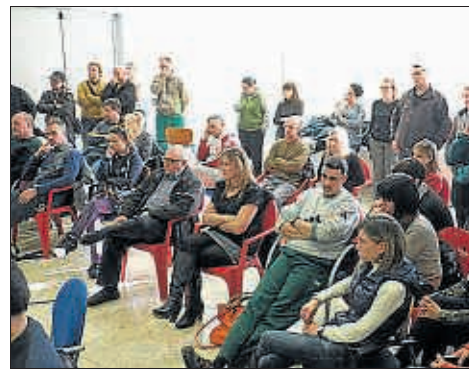
Afectats de la cooperativa de Cambrils